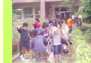
朝のボランティア,