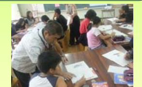
初任者研修示範授業