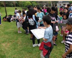
PTAウォークラリー大会