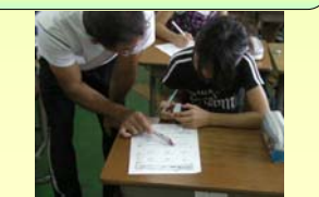
学習ボランティア