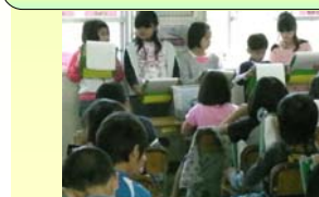
校内での研究授業