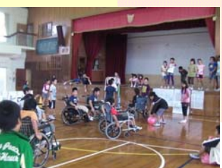
泡瀬特別支援学校との交流