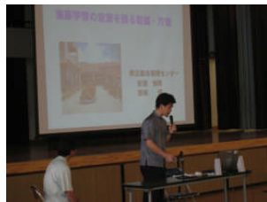
“家庭学習に関する講演会”