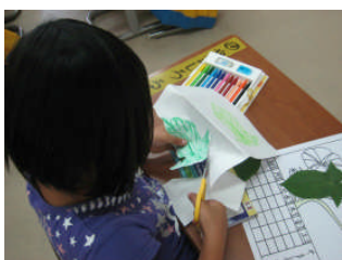
“あさがおのカレンダーづくり”

6月12日（日）に行われた「日曜参観・学校説明会・講演会、そしてPTAスポーツ大会への参加、大変ありがとうございました。各家庭よりお父さん、お母さんをはじめ、おじいちゃん、おばあちゃんの参観もあり、子どもたちの励みとなりました。学級によっては、保護者の参加のある授業もありました。2学年は親子スポーツ大会で親子で気持ちのいい汗を流しました。学校説明会、そしてその後開催した「学校説明会」「家庭学習に関する講演会」にも多くの皆さまの参加がありました。参加して下さった方々からの感想では良かったとのことでした。講演会でお聞きになったことを実践に繋げていってください。午後に開催されたPTAスポーツ大会も多くの参加があり、とても盛り上がりました。本当にありがとうございました。