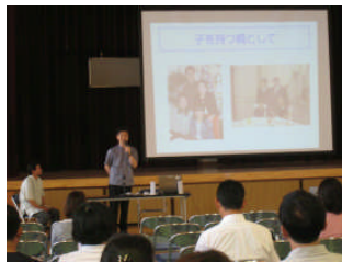
「親子の関わりと会話が学力を伸ばします」