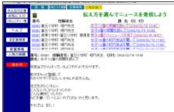
(電子掲示板での北海道とのやりとり)