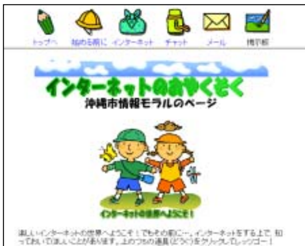
( 沖縄市情報モラルのページ～トップ画面～ )

http://www02.bbc.city.okinawa.okinawa.jp/oki/gyousei/gokk/12-joho_moral/moraltop.htm