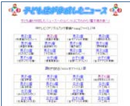
(HPに公開した児童のニュース)