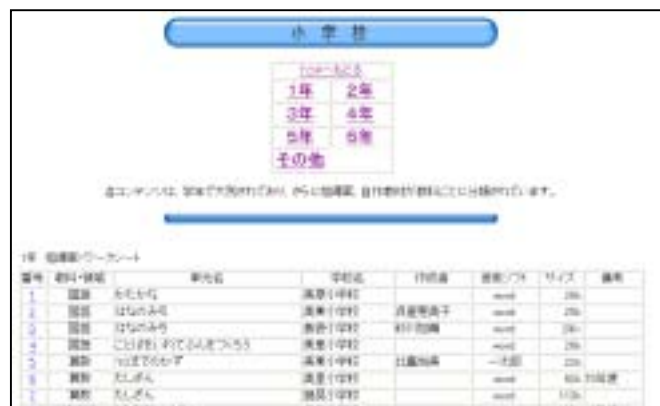
(小学校のコンテンツ一覧画面)