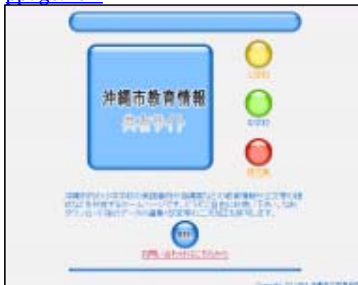
(沖縄市教育情報共有サイト トップ画面)

http://www02.bbc.city.okinawa.okinawa.jp/oki/gyousei/gokk/00-digital_contents/oki-joho/toppage.htm